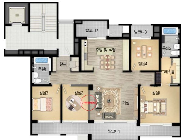
| 기본형 |