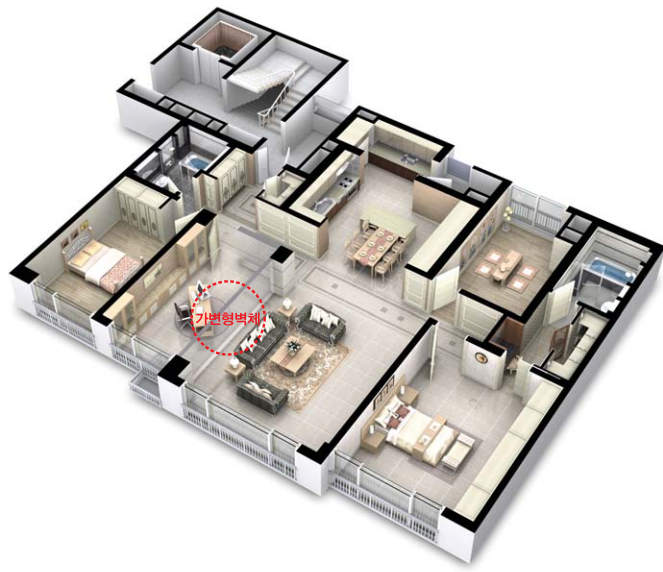
| 확장형 |