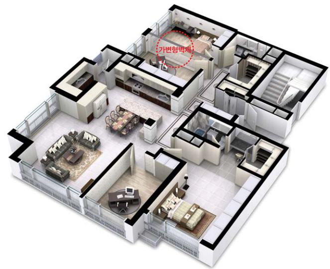
| 확장형 |