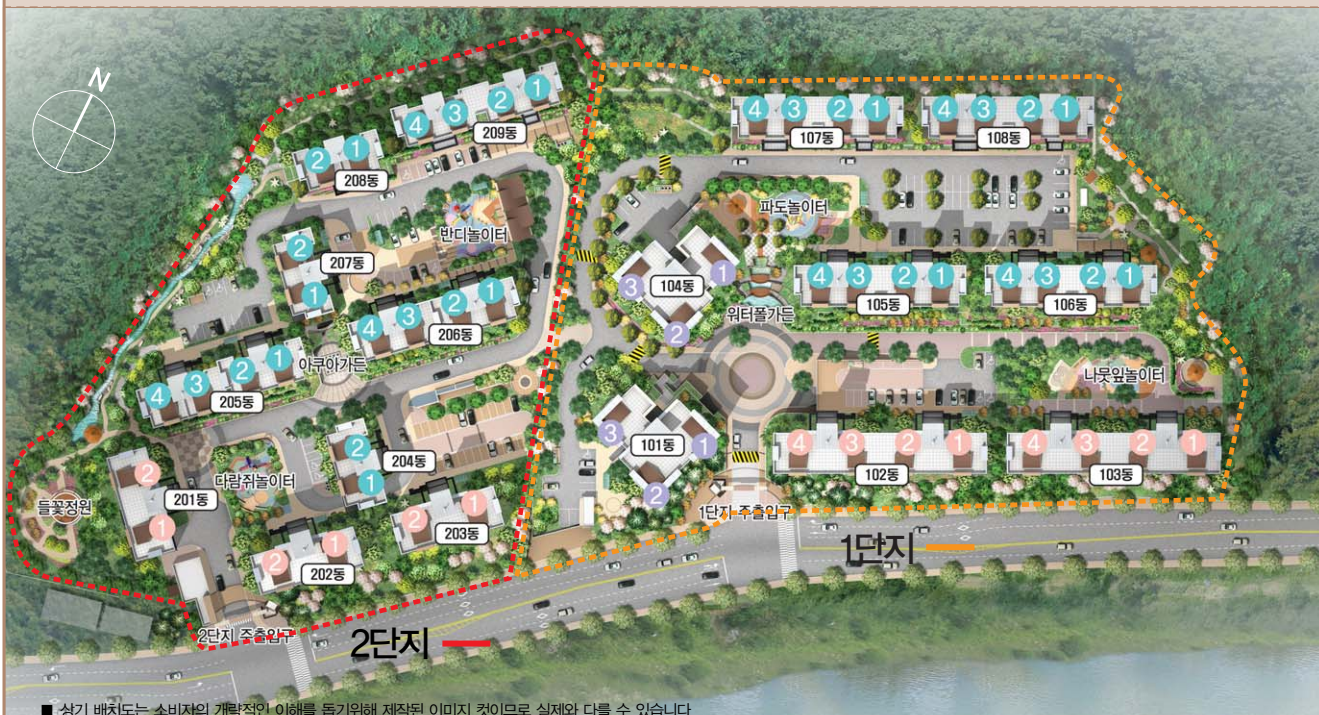
■ 상기 배치도는 소비자의 개략적인 이해를 돕기위해 제작된 이미지 것이므로 실제와 다를 수 있습니다.

햇살과 바람이 자유롭게 소통하는 미래형 친환경 단지- 그대가 거느리는 세상은 조금 더 크고 특별해야 합니다.