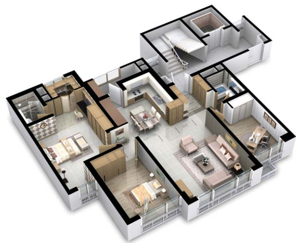
| 확장형 |