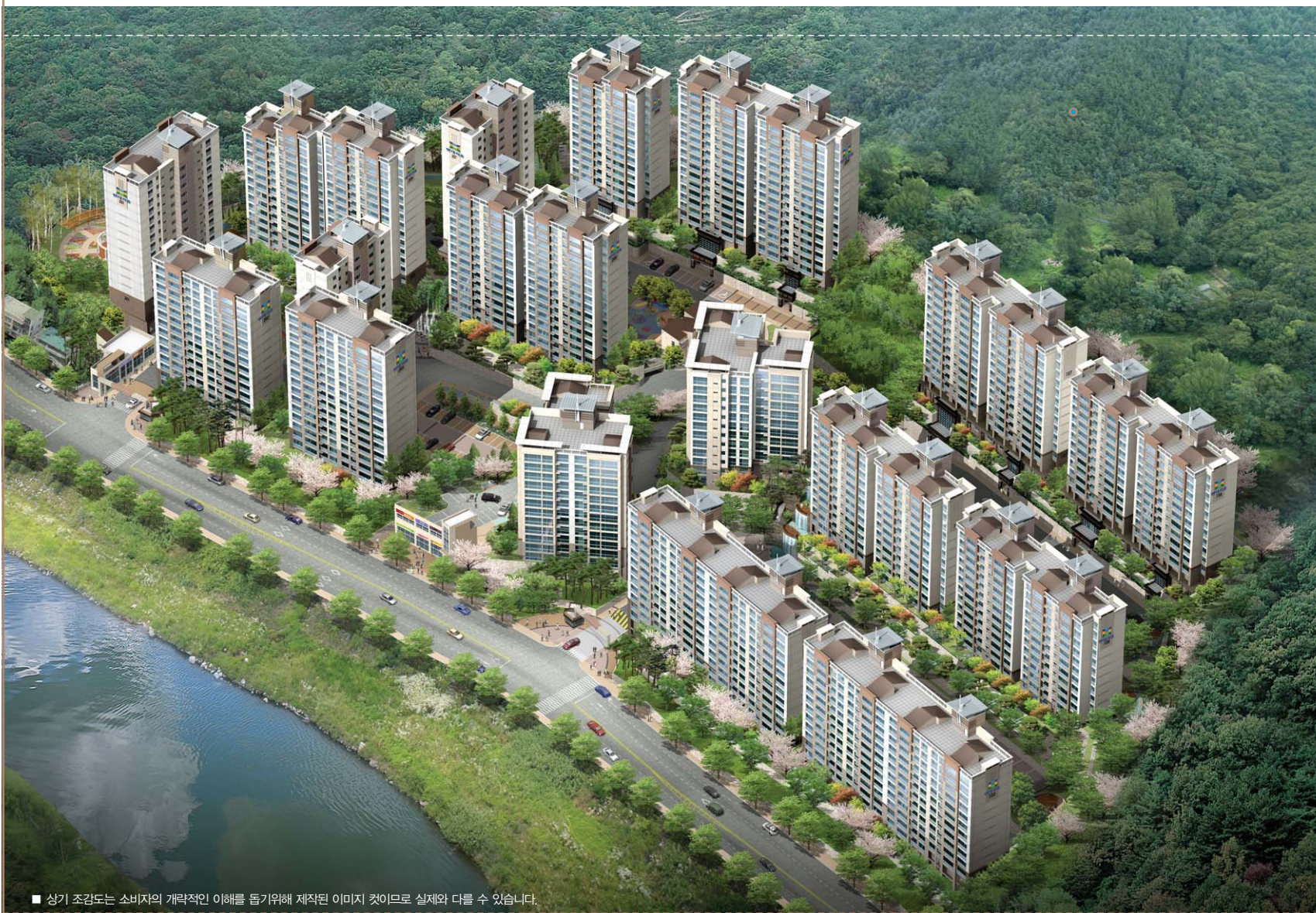
■ 상기 조감도는 소비자의 개략적인 이해를 돕기위해 제작된 이미지 것이므로 실제와 다를 수 있습니다.