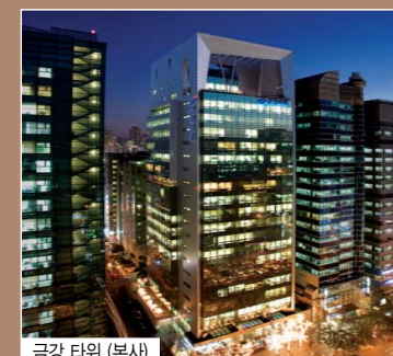
금강 타워 (본사)

세계를 향한 큰 비전으로 대한민국의 경제를 움직이고 선도해 나가는 기업을 위해, 최적의 비즈니스 환경을 갖춘 오피스 빌딩을 금강이 만들어 갑니다.