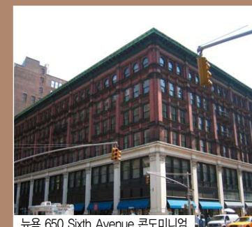
뉴욕 650 Sixth Avenue 콘도미니엄

이제 금강주택의 꿈은 세계를 향해 있습니다. 금강주택이 우수한 기술력을 바탕으로 대한민국 건설의 힘을 전세계에 널리 알리고 있습니다.