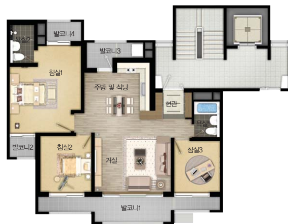
| 기본형 |