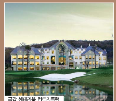
금강 센테리움 컨트리클럽

세계적인 장인정신과 골프장건설의 남다른 신념이 만들어낸 역작, 센테리움 컨트리클럽을 시작으로, 금강이 세상을 더 아름답게 바꿔갑니다.