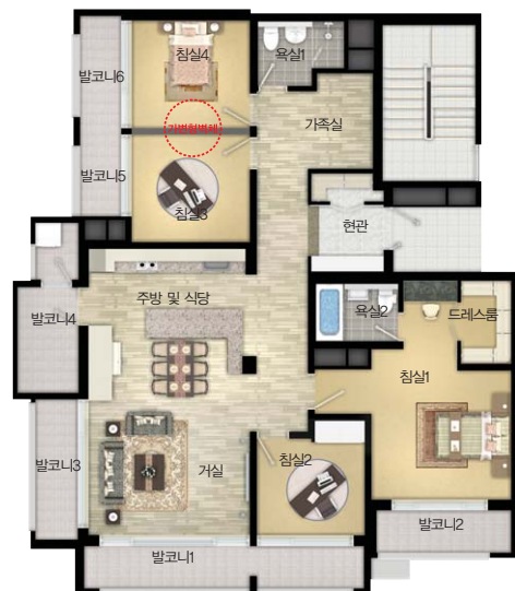
| 기본형 |